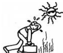
2. hace mucho calor